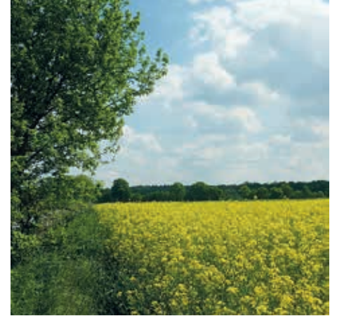
Boßeln in lauer Maienluft und Rapsduft