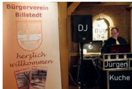
Sorgt wieder für Schwof: DJ Jürgen Küche

Sonnabend, 14. März 2020, 18:00 Uhr, „Danz um de Tüffel“, 29,50 Euro (Preis gilt auch für Mitglieder des Grundeigentümergebietes und Vorwärts-Wacker), für Gäste 32,50 Euro. Gasthof Schwarzenbeck, 22113 Oststeinbek (Havighorst), Dorfstraße 26 Um rechtzeitige Anmeldung bis zum 9.3.2020 wird gebeten! DerBi