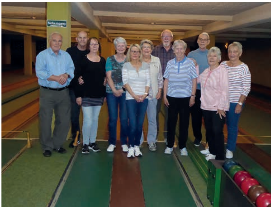
Wieder aktiv: Kegelgruppe